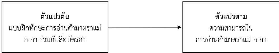
ภาพที่ 1 กรอบแนวคิดวิจัย ที่มา : ผู้เขียน