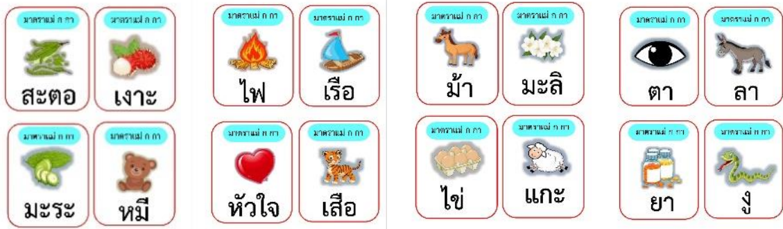
ภาพที่ 3 สื่อบัตรคำ